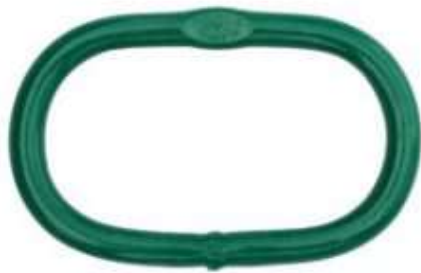
ANILLA MAESTRA MLW